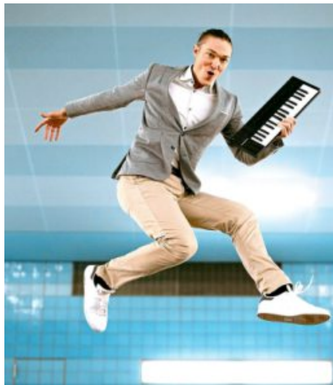
Andreas Langsch kommt nach Borchten.

Andreas Langsch wurde bereits vierfach mit renommierten Kabarettpreisen ausgezeichnet – jeweils Jury- und Publikumspreis. Alles in allem ein Abend für alle, die lieben, geliebt werden (wollen) und/oder einen großartigen Theater- und Konzertabend genießen möchten, der für 90 Minuten die Alltagsorgen vergessen lässt.