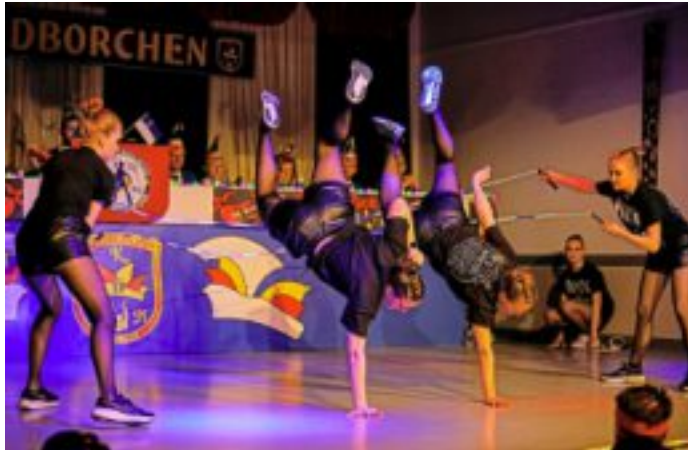
Sportlich wussten einmal wieder die Rope Skipper des SC Borchten zu überzeugen.