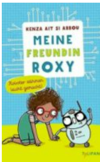
„Meine Freundin Roxy – Roboterzähmen leicht gemacht“ von der KI-Expertin und Autorin Kenza Ait Si Abbou. Die

Gemeinsam mit der Initiative „Zukunftsidealisten Borchten“ veranstaltet die Bücherei den Nachmittag, der sich an Kinder im Grundschulalter richtet. Ab 15 Uhr wird gelesen, gebastelt, gemalt und verschiedene Roboter ausprobiert. Kinder sind aufgerufen, eigene Roboter mitzubringen und sie anderen Kindern zu präsentieren. Gelesen wird aus dem Buch