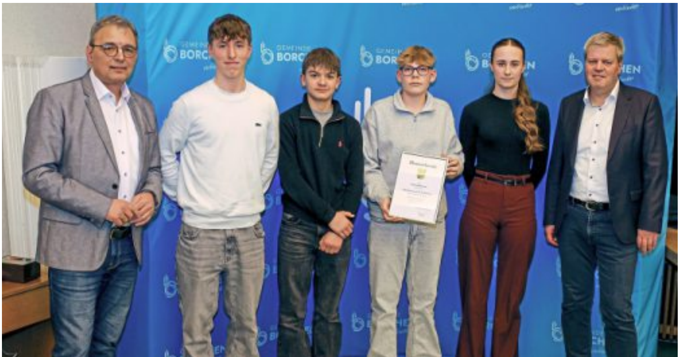
Die Tischtennis A-Jugend vom SV Rot-Weiß Alfen.