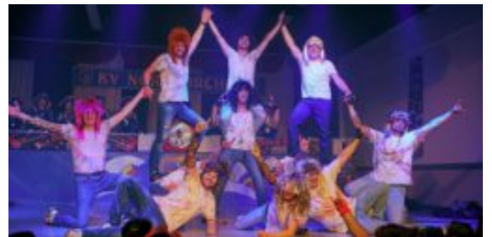
Das Männerballett des KVN sorgte in diesem Jahr als Rockmusiker verkleidet für Stimmung in der Halle.

Nachdem das Programm bis dahin für die zahlreichen