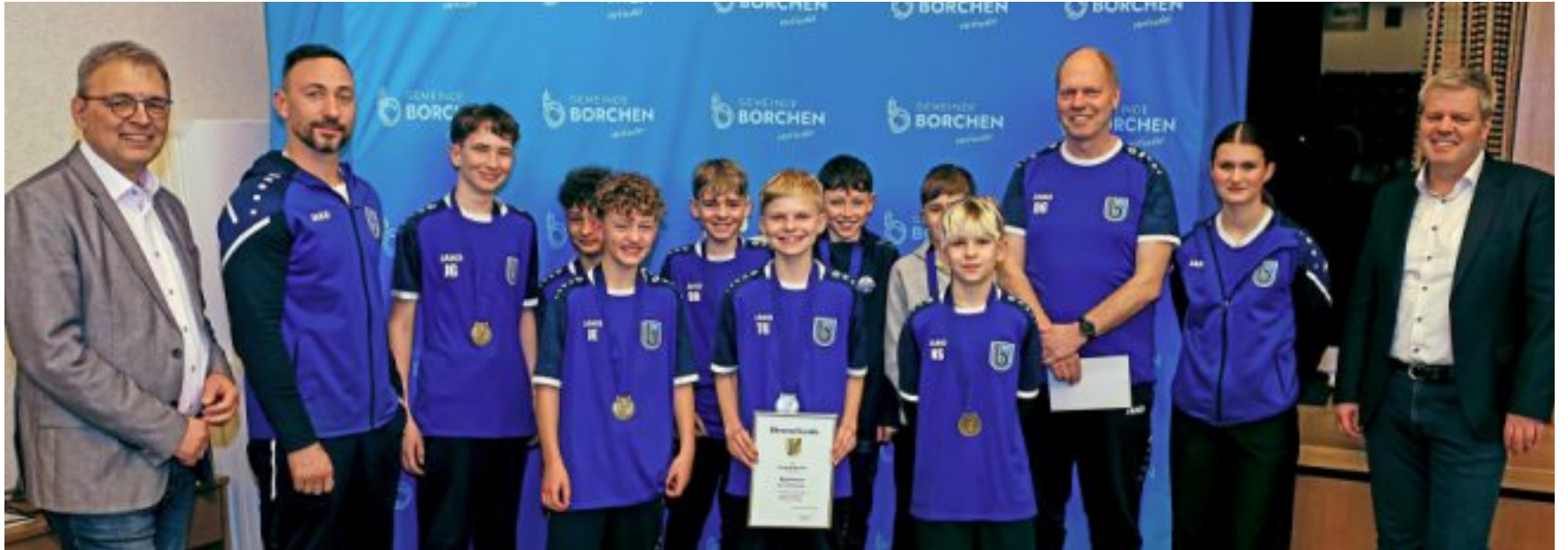
Ein Teil der B- und E-Juniorenfußballer des SC Borchchen.

Vier weitere Ehrungen gingen an die Tischtennis-Mannschaften des SV RW Alfen. Die 1. Mannschaft wurde für den Aufstieg in die 1. Bezirksliga geehrt. Der 2. Mannschaft gelang 2025 der Aufstieg in die 2. Bezirksklasse. Auch die 3. Mannschaft wurde geehrt, sie stieg in die 2. Bezirksklasse auf.