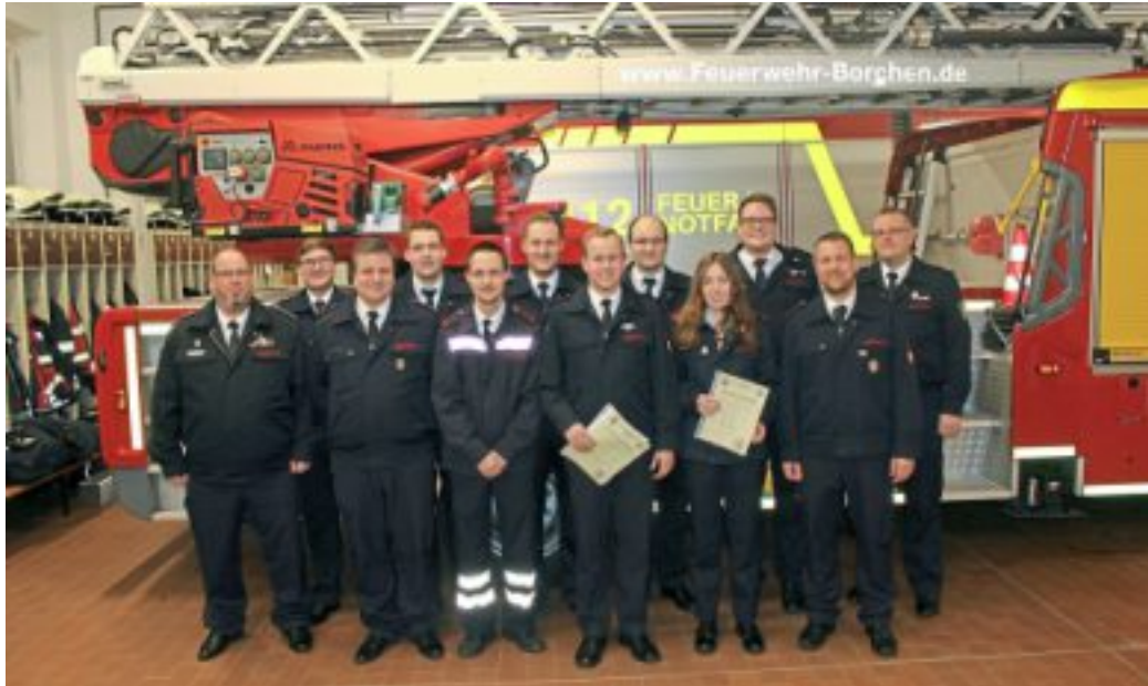
Die Geehrten und Beförderten des Löschzugs Kirchborchen.