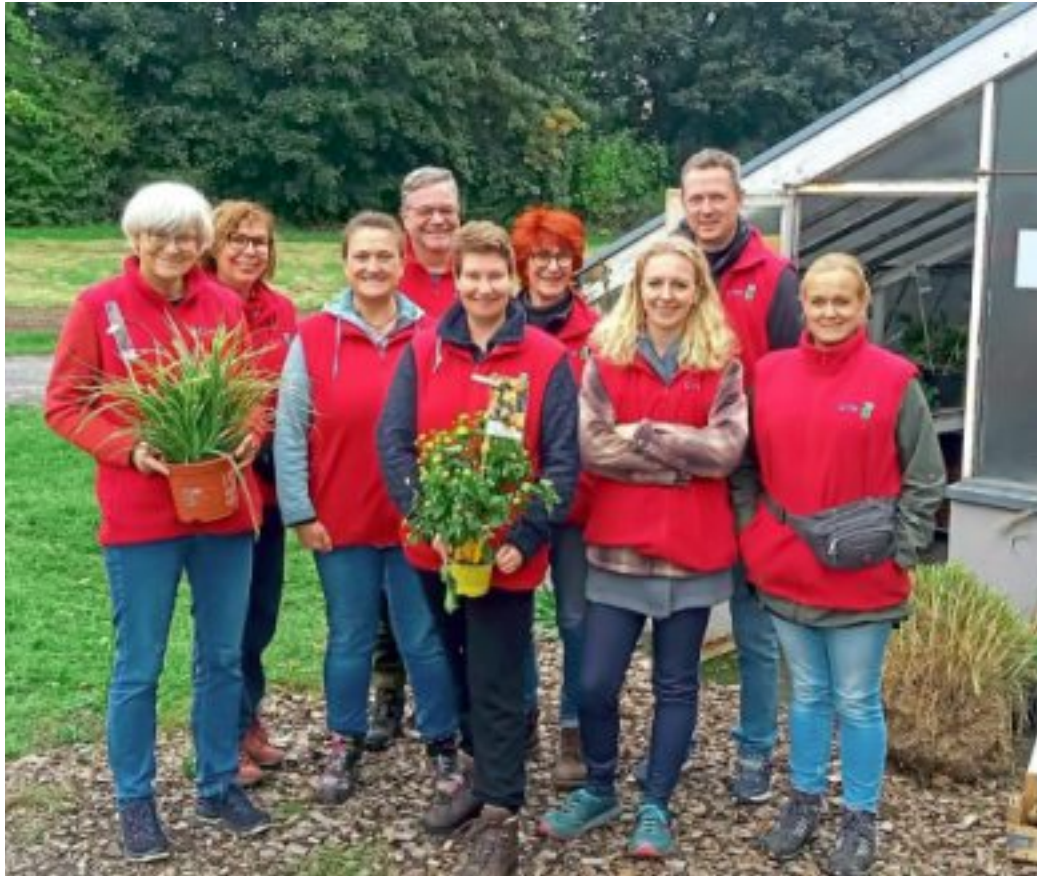
Die Naturschutzgruppe Borchchen hat 2026 einiges geplant.