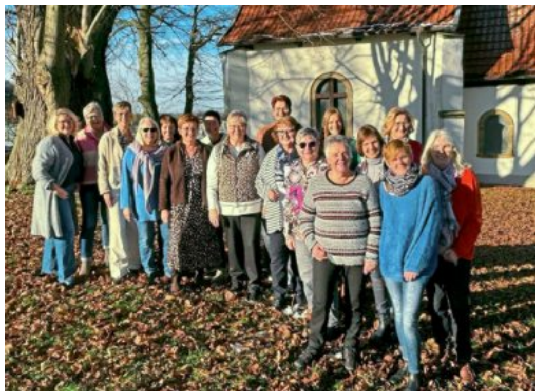
Ehrenamtliche Helferinnen der KFD Dörenhagen.