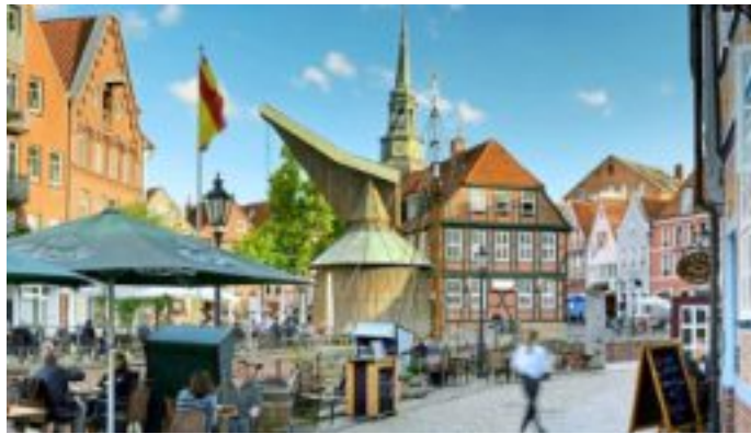
Am dritten Tag der Bürgermeisterfahrt wird die Hanse- und Märchenstadt Buxtehude besucht.

1. Tag (Freitag, 2. Oktober) Anreise ins Alte Land nach Jork. Von den Haltepunkten in Borchten geht die Anreise direkt ins Alte Land nach Jork, dem Zentrum des Obstanbaus in dieser Region. Bei