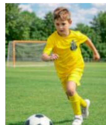
So sieht das neue Trikot der Borchener Auswahlmannschaft aus.

Wer Teil dieses besonderen Abenteuers sein möchte oder Fragen zur Teilnahme hat, ist herzlich eingeladen, sich per E-Mail an rwa@alfen.de zu melden. Die Organisatoren vom SV Rot-Weiß Alfen freuen sich über jedes Kind, das dabei sein möchte – und über alle, die diese einmalige Aktion unterstützen.