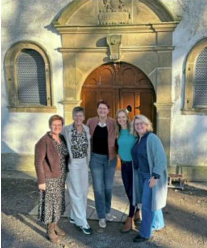
Der aktuelle Vorstand der KFD Dörenhagen.

Gruppe der Frauen Ü60, die sich wöchentlich zur Sitzgymnastik trifft und in den Wintermonaten zum gemütlichen Austausch in der Bücherei zusammenkommt. In den Sommermonaten ergänzen gemeinsame Spaziergänge oder kleine Ausflüge das Programm.