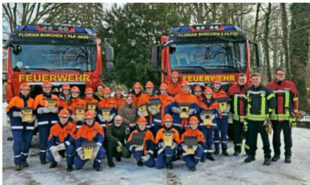
Die Jugendfeuerwehr Borchchen präsentiert die selbst gebauten Nistkästen.

Die Aktion wurde von allen Beteiligten mit großem Engagement durchgeführt. Mit dem Projekt leistet die Jugendfeuerwehr Borchchen einen wertvollen Beitrag zum Naturschutz und zeigt, dass ehrenamtliches Engagement weit über den Feuerwehrdienst hinausgeht.