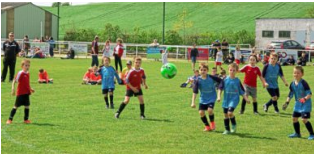
Im Mai wird wieder viel Fußball gespielt.

Die jungen Fußballerinnen und Fußballer wohnen wäh-