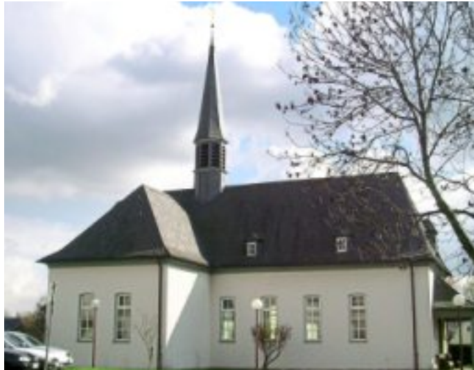
Am 13. Dezember fand in der Stephanuskirche ein Benefizkonzert zugunsten des Borchener Warenkorbes statt.

Die Pause verbrachten viele Besucherinnen und Besucher vor der Kirche bei Glühwein, heißem Kakao und frisch zubereiteten Reibplätzchen.