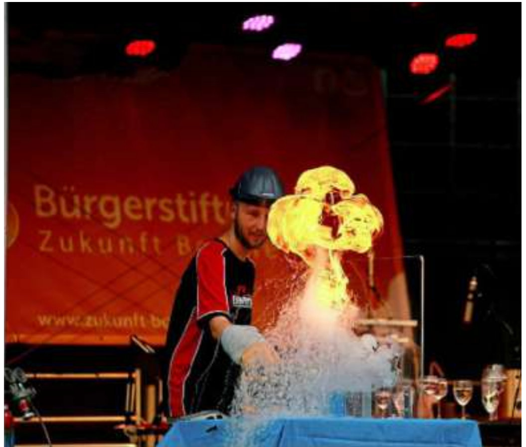
Bei „Umsonst und draußen“ gab es im August unter anderen Event Physik zu sehen. Mehr dazu auf Seite 10.

An die Gemeinde Borchten Unter der Burg 1 33178 Borchten