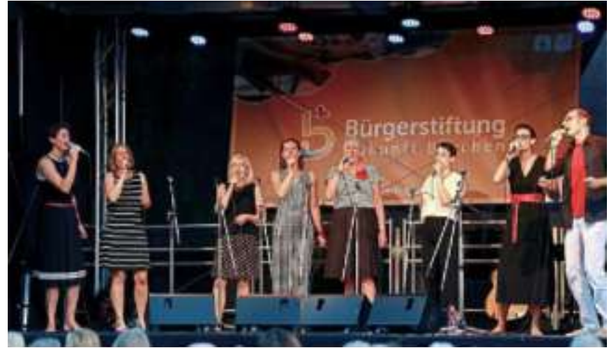
Das Paderborner Vokalensemble Anis oder Mandel.