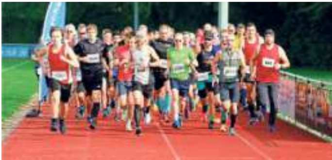
Rund 80 Läuferinnen und Läufer begaben sich auf die Halbmarathonstrecke.