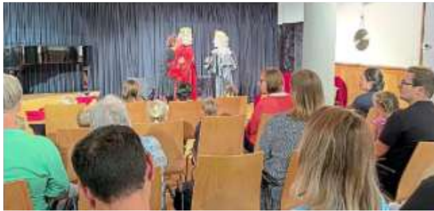
Das Figurantentheater musste drinnen stattfinden.