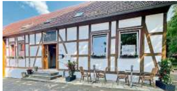
Das Landhauscafé befindet sich in diesem Fachwerkhause in Nordborchen.

Geöffnet ist das Café von mittwochs bis sonntags, jeweils von 12 bis 19 Uhr. Montags und Dienstag nur für geschlossene Gesellschaften.