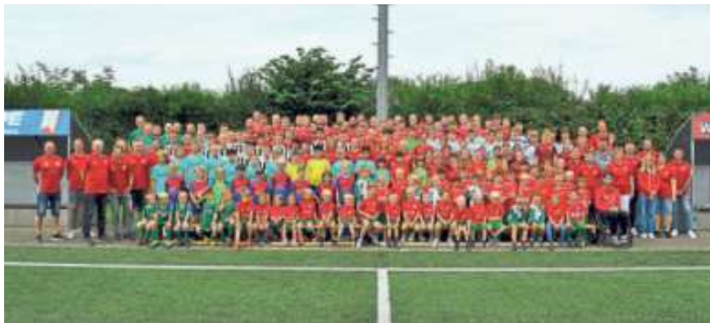
Alle Spieler und Betreuer auf einem Bild.

Gemeinsam mit den Kindern freuen wir uns nun auf eine gute Ernte von Gurken, Kohlrabi, Salat und Möhren und sagen danke an die Edeka-Stiftung für so ein tolles Projekt!