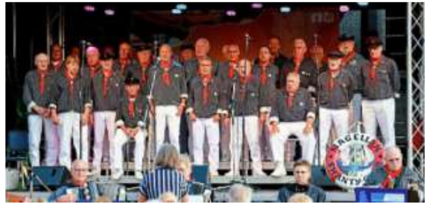
Der Magellan Shantychor sorgte für maritime Unterhaltung.

Zahlreiche unterschiedliche Veranstaltungen begeistern die Zuschauer