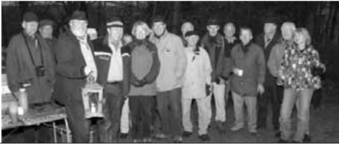
Foto: 20 Naturfreunde waren der Einladung des Umwelt- und Kulturvereins Alfen gefolgt und erkundeten den Gellinghauser Forst.