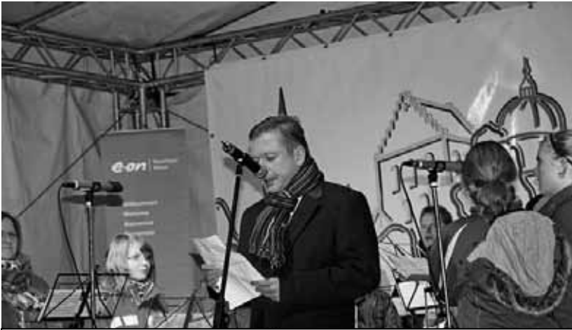
Foto: Bürgermeister Reiner Allerdissen eröffnet den 6. Borchener Adventsmarkt.

Wie in jedem Jahr sorgte rund um den Adventsmarkt ein abwechslungsreiches Bühnenprogramm für Unterhaltung. Neben Schulen und Kindergärten traten in diesem Jahr auf der Veranstaltungsbühne beispielsweise der Musikverein Dörenhagen, die KfD Kirchborchen, der Gemischte Chor Alfen und der Kirchenchor St. Laurentius aus Nordborchen auf.