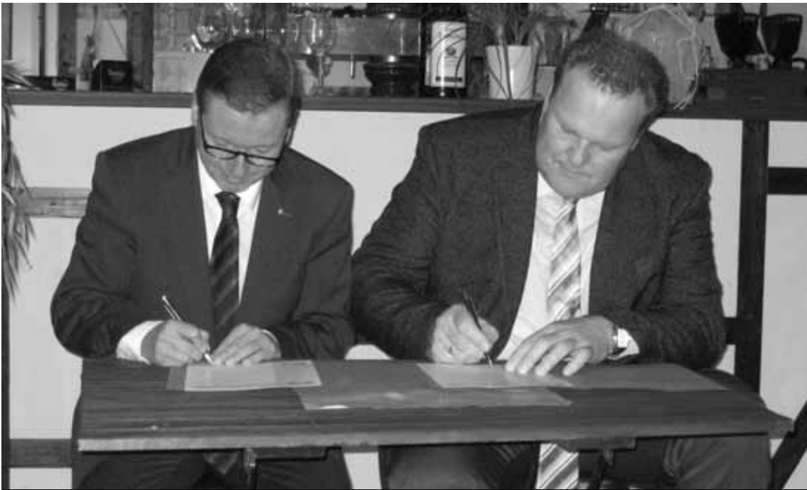
Foto: Borchens Bürgermeister Reiner Allerdissen (links) und Bürgermeister Frank Broshog (Gemeinde Am Mellensee) bei der Unterzeichnung der neuen Partnerschaftsurkunden.

Gleichzeitig unterzeichneten Borchens Bürgermeister Reiner Allerdissen und Bürgermeister Frank Broshog als Vertreter der Gemeinde Am Mellensee neue Partnerschaftsurkunden, mit der die Städtepartnerschaft nun auf die gesamte Gemeinde Am