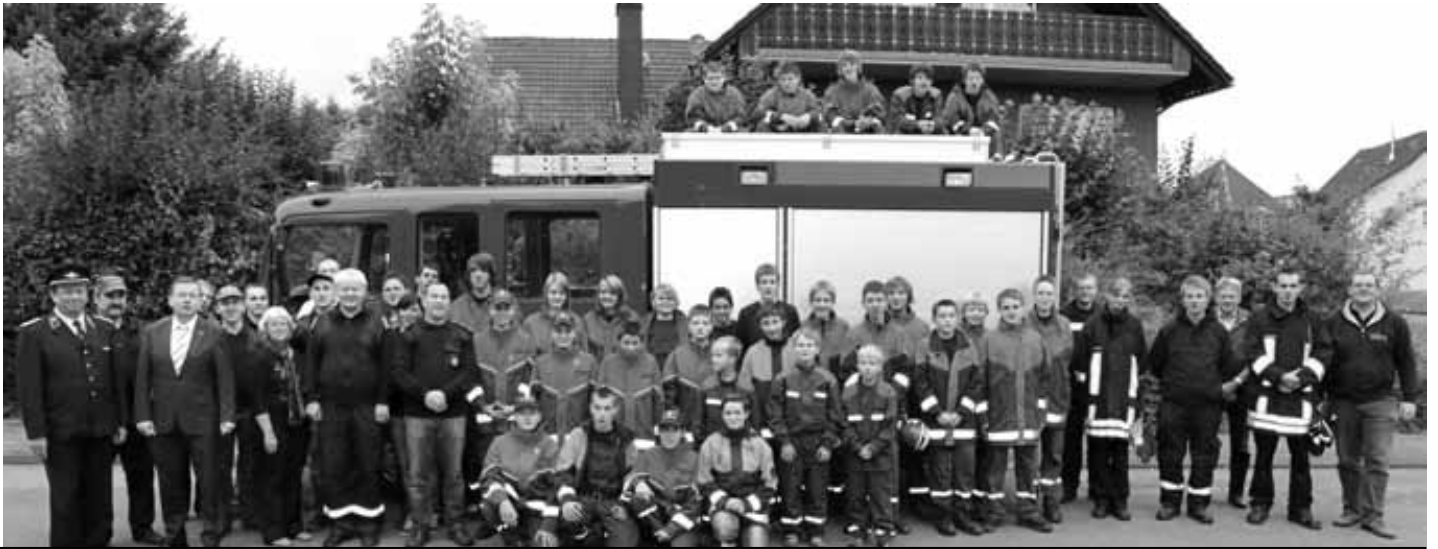
Foto: Die Freunde der Jugendfeuerwehr Schwarzenberg zusammen mit der Jugendfeuerwehr Borchener und den Betreuerinnen und Betreuern sowie Bürgermeister Reiner Allerdissen (3.v.l.).