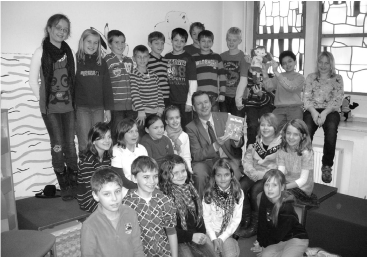
Foto: Bürgermeister Reiner Allerdissen inmitten der Kinder der Klasse 4a der Grundschule Nordborchen.