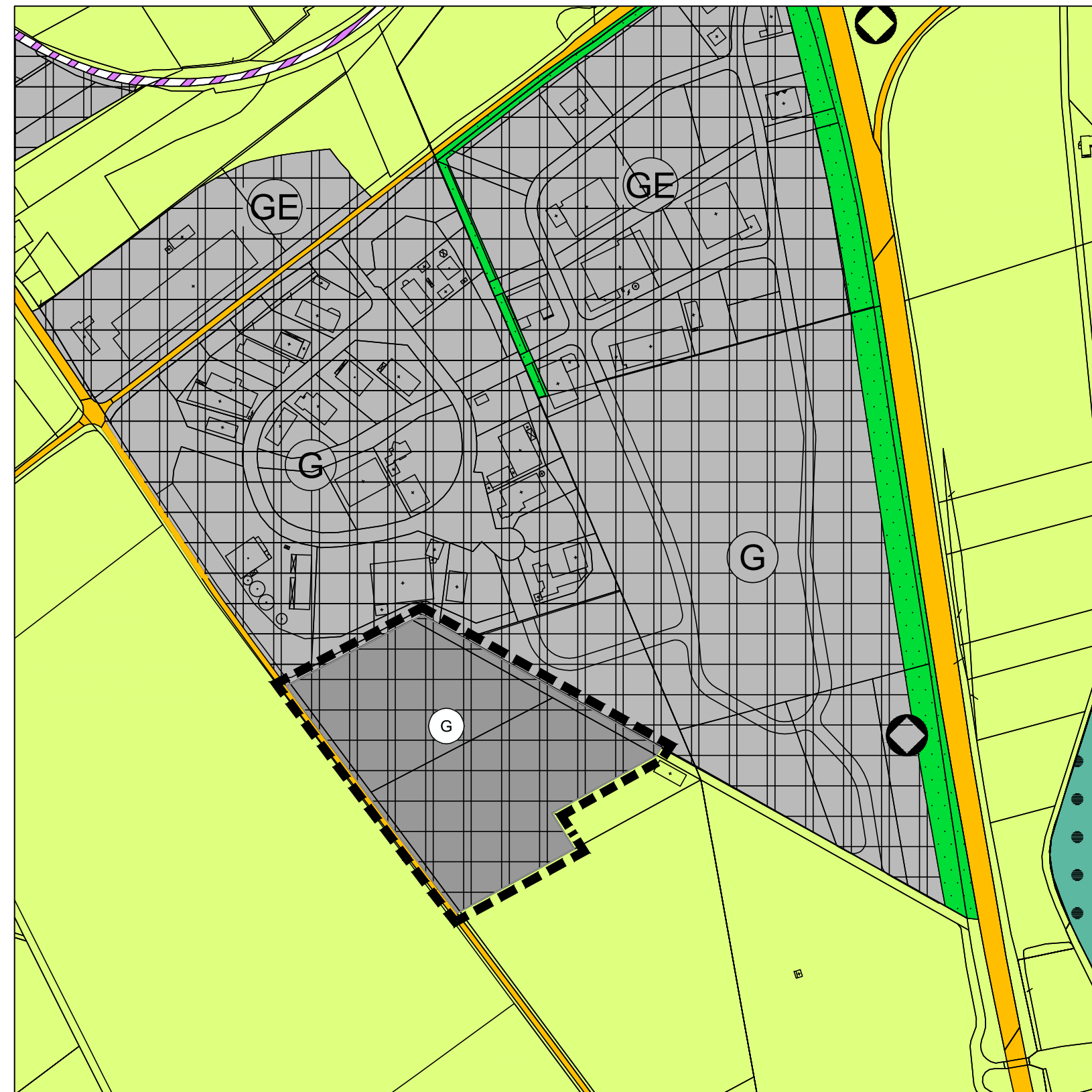
geplante Änderung des Flächennutzungsplanes