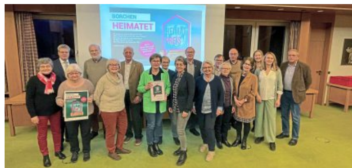
Der Deutsch-Französische Freundschaftskreis Alfen kam auf Platz drei.