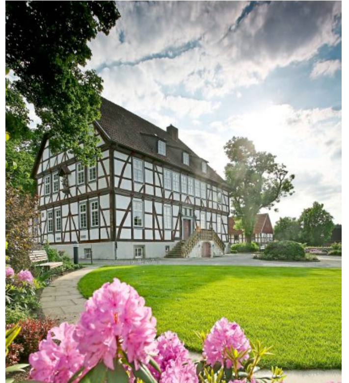
Während der Rallye lernt man die Gegend rund um den Mallinckrothhof besser kennen.

Die Rallye kann so praktisch zu jeder Wochen- und Tageszeit durchgeführt werden. Nach einer erfolgreichen Entdeckungstour gibt es eine passend gestaltete Urkunde. Als Höhepunkt können die Urkunden beim Bürgerservice im Borchener Rathaus zu den geltenden Öffnungszeiten abgestempelt werden.