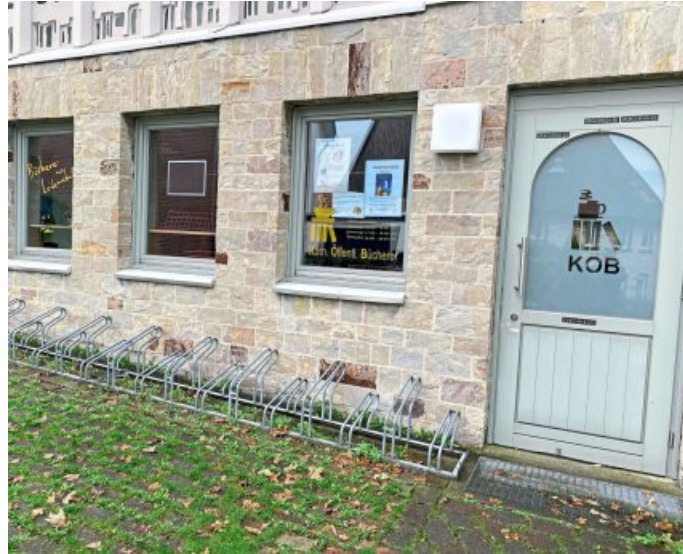
Die KÖB in Nordborchen.

Die Finanzierung der Büchereien wird vom Erzbistum Paderborn, der Gemeinde Borchon sowie den Pfarrgemeinden getragen.