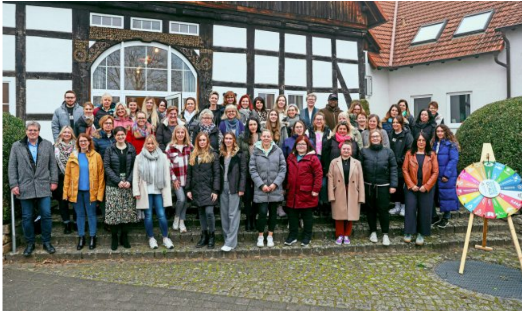
Erzieherinnen und Erzieher der kommunalen Kindergärten der Gemeinde Borchten lassen sich Einblicke zur Nachhaltigkeitsarbeit in Kindergärten geben.