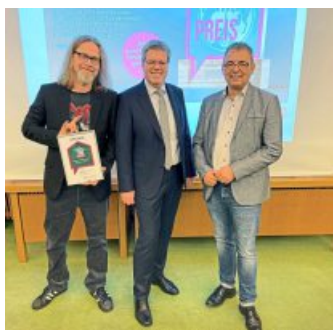
Platz zwei: Tag der Musik Alfen.