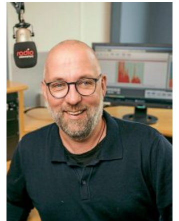
Moderiert den Talk: Holger Winkelmann.

40. Ausstellung von Künstlerin Nicola Gerlich – Vernissage am 14. April