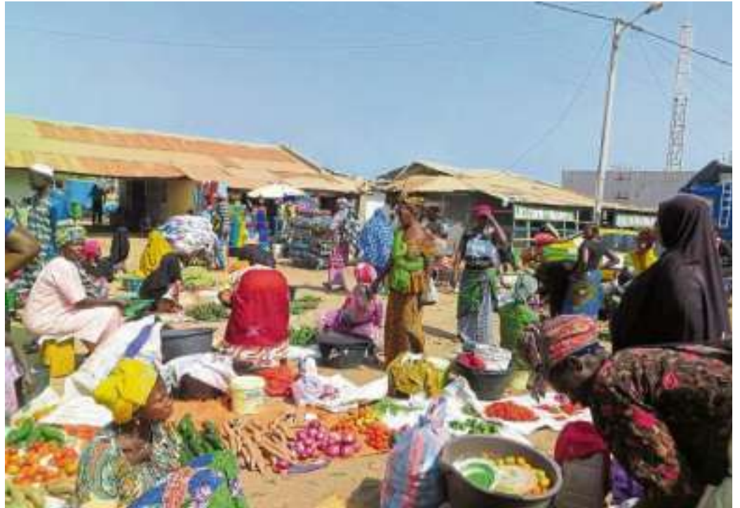
Um Traditionen, Menschen und Kulturen – kurzum das bunte Leben Afrikas – dreht sich eine Veranstaltungsreihe der Flüchtlingshilfe Borchten mit der Volkshochschule.

Die Teilnahme an den Veranstaltungen ist bis auf den letzten Abend (Kosten: 10 €) kostenlos. Eine Anmeldung ist unter www.vhs-paderborn.de oder telefonisch unter 05251 3888123 erforderlich. Weitere Informationen gibt es unter www.vhs-paderborn.de .